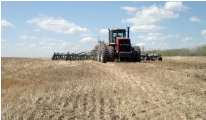
Semis dans du chaume à Camrose

Un bon départ à vos semis permettra d'avoir des cultures plus compétitives et des peuplements en meilleure santé.