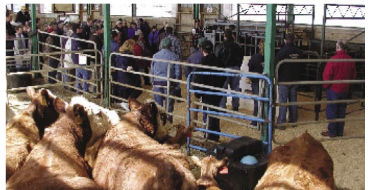
Les producteurs assistent à un atelier sur les stratégies alimentaires à la ferme expérimentale d'AAC, Nappan, N.-É.

Gordon Fairchild, Spécialiste en sol Centre de conservation des sols et de l'eau de l'Est du Canada