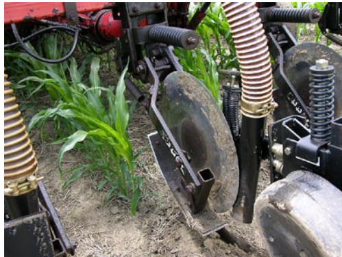
Un injecteur à fumier Yetter en montre sur un site de démonstration.

En juin 2005, une démonstration d'application de fumier entre les rangs a eu lieu dans le comté de Perth afin de permettre aux producteurs de voir cette pratique au champ. Différentes configurations de barres porte-outils ont été présentées par diverses compagnies. La conception des coutres ou de l'injecteur variait significativement parmi les différents équipements présentés.