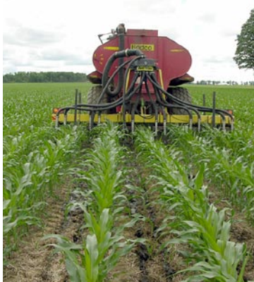
Application de fumier entre les rangs à l'aide d'un camion-citerne Bodco et d'une barre porte-outils Aerway lors d'une activité de démonstration.