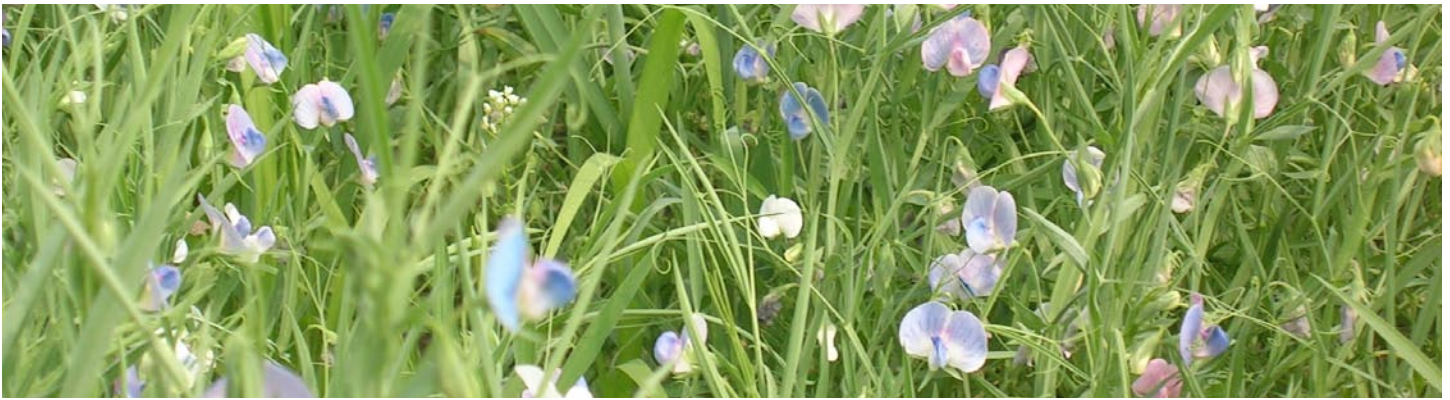
Essais sur les engrais verts (gesse, variété AC greenfix) chez la Ferme Longprés, Les Cèdres, QC

Environ 162 personnes assistent à quatre journées thématiques sur la culture sur billon cet été sous le Programme canadien d'atténuation des gaz à effet de serre pour le secteur agricole.