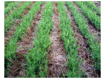
Taux élevé de semis dans une haute quantité de résidus