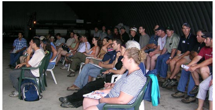
Producteurs assistant à une conférence sur les BPG et GES lors d'une visite à la Ferme Longprés

Discussion sur la structure des sols avec culture sur billon, Les Cèdres, QC